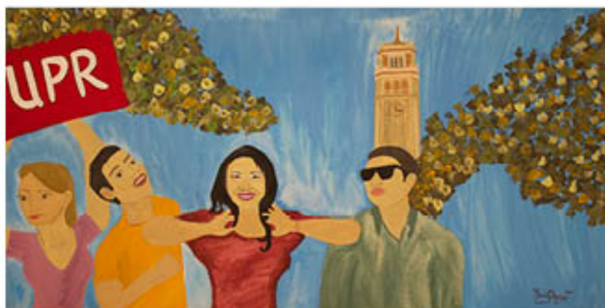
YANIROCA (Puerto Rico) UPRRP, los estudiantes, la lucha y la educación, 2012 Acrylic and colored pencil on canvas, 24" x 48"